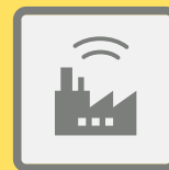
ГУДКИ ПРЕДПРИЯТИЙ И ТРАНСПОРТНЫХ СРЕДСТВ