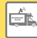
ПОДВИЖНЫЕ ЗВУКОУСИЛИТЕЛЬНЫЕ УСТАНОВКИ